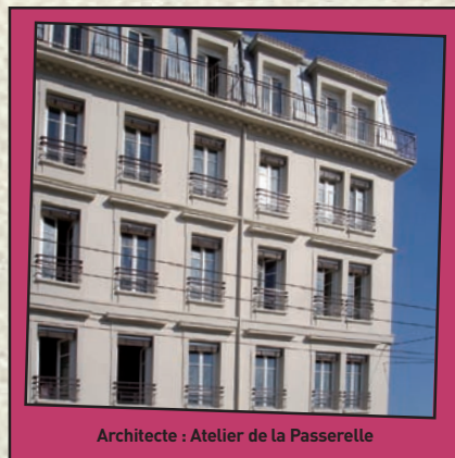
Architecte : Atelier de la Passerelle

Le 10 novembre 2009, a eu lieu l'inauguration d'un immeuble ancien rénové au 10, rue Saint-Simon à Lyon 9 e . Il s'agit d'une résidence sociale gérée par l'association ARALIS et appartenant à GRANDLYON HABITAT. Depuis quelques années, GRANDLYON HABITAT aménage des logements pour des associations qui partagent les mêmes valeurs : mobiliser les solidarités dans un acte citoyen, afin de faire « mieux vivre ensemble » tous nos locataires et de rendre la cité plus humaine pour tous.