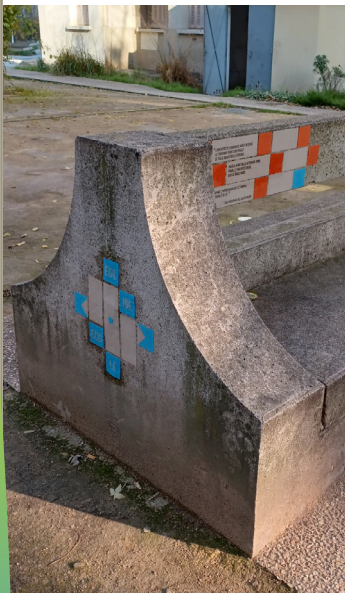
Projet artistique - Cité Tony Garnier (Lyon 8 e )

Pendant les vacances de printemps, deux chantiers jeunes ont été lancés dans le 8 e arrondissement de Lyon.