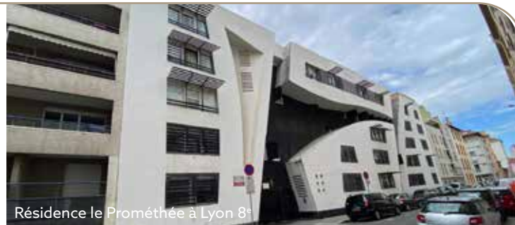
Résidence Le Prométhée à Lyon 8 e

► La résidence Le Prométhée fait peau neuve : Construite en 2002, cette résidence de 40 logements va bénéficier d' une rénovation dès septembre 2024 pour une durée d'environ 11 mois . Les travaux, financés à hauteur de 1 350 000€ par GrandLyon Habitat, incluent le changement des fenêtres, le ravalement de la façade, l'étanchéité et l'isolation de la toiture, la réfection des contrôles d'accès. L'objectif est d'améliorer la qualité de vie des habitants.