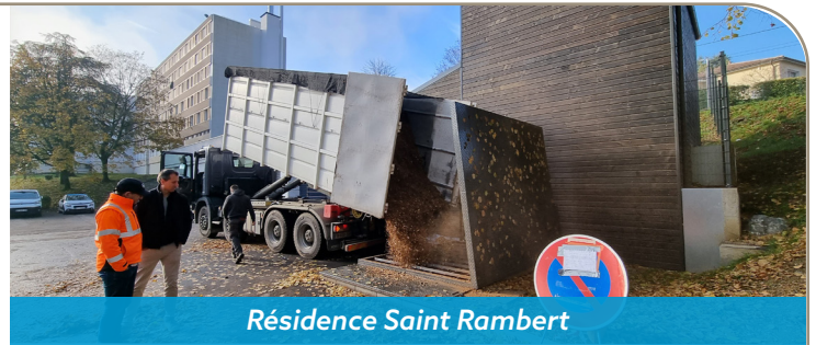
Résidence Saint Rambert

Ce mois-ci, GrandLyon Habitat présente deux opérations de réhabilitation.