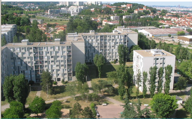
Résidence la Croix des Platanes

L'objectif est de faire des économies d'énergie , aussi bien pour l'environnement que pour les locataires. Cela permet de limiter l'augmentation massive des charges locatives .