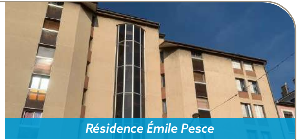
Résidence Émile Pesce

Au programme de ces travaux, l'isolation renforcée des bâtiments avec des éco-matériaux, de nouvelles fenêtres, la création d'un système de ventilation, la production de l'eau chaude grâce au réseau de chaleur urbain (suppression des cumulus individuels), la création de balcons pour tous les logements, la rénovation complète des salles-de-bains, WC et cuisine, la création de locaux vélos et poussettes. Si les locataires valident ce projet et si la consultation des travaux est conforme au budget, le chantier pourra commencer au printemps 2024.