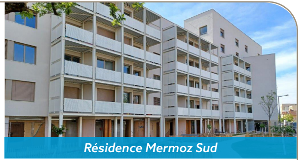
Résidence Mermoz Sud

Pendant plus de 2 ans, la résidence ARKAO, située à Mermoz Sud, a fait l'objet d'importants travaux pour améliorer le confort à l'intérieur des logements et leur performance énergétique. 36 logements ont été démolis, le bâtiment existant a été rénové et une extension de 18 logements a été créée. Aujourd'hui, la résidence compte 46 logements et a été inaugurée le 22 septembre.