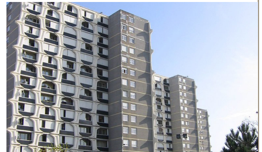
Résidence Maurice Langlet

Au programme cet automne : démolition d'un local technique inutilisé, mise en service de 10 abris sécurisés pour les vélos et les motos et plantation de nouveaux végétaux.