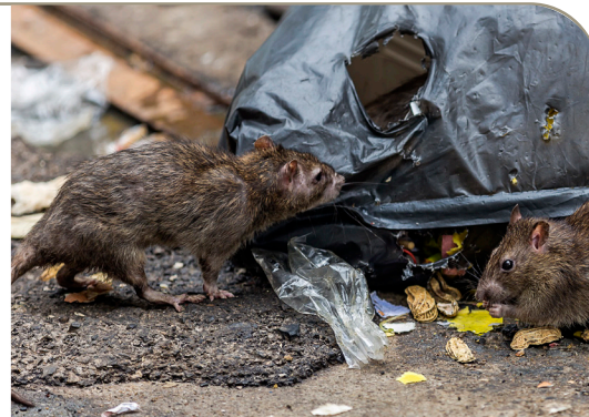
Les déchets au sol attirent les rats

Votre implication est aussi essentielle pour éviter d'attirer les rats dans votre résidence.