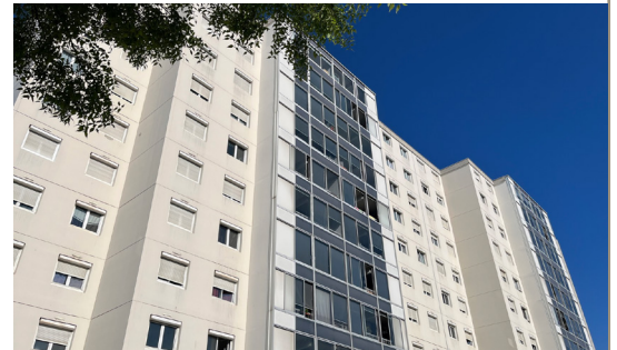
Résidence Le Jardin des Maraîchers

Après une période de consultation des entreprises, le chantier démarrera au 3 e trimestre 2024. Le chantier devrait se terminer au 3 e trimestre 2026.