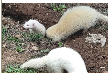
Des furets pour attraper les rats