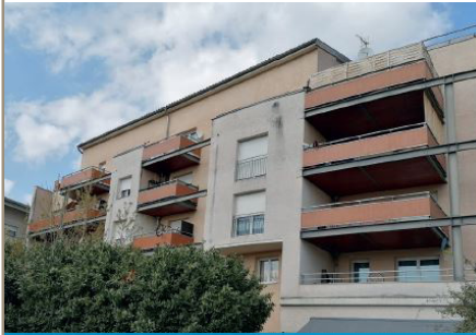
Les Balcons de Cassiopée

► Les Balcons de Cassiopée : une réhabilitation thermique en cours.